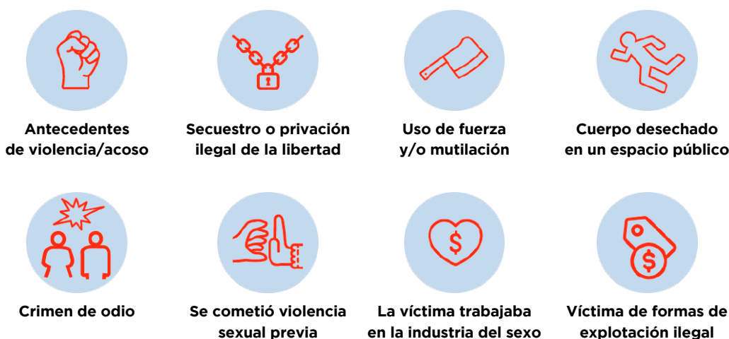
Figura 3: Características indicativas de las motivaciones por razones de género en los homicidios de mujeres y niñas (femicidio/feminicidio)